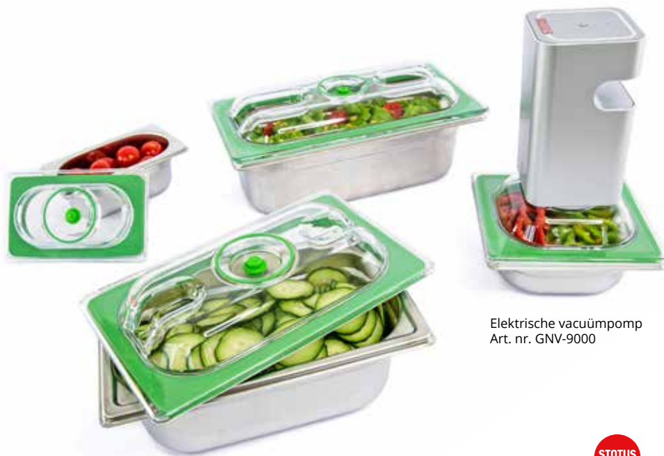
Elektrische vacuümpomp Art. nr. GNV-9000

advies : gebruik de vacuüm deksels uitsluitend met gastronormbakken uit roestvrijstaal met EU-certificaat.