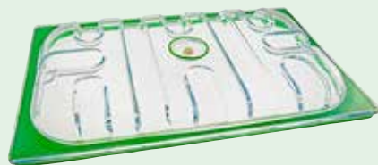
GN1/1 - 534 x 329 mm Art. nr. GNV-9011