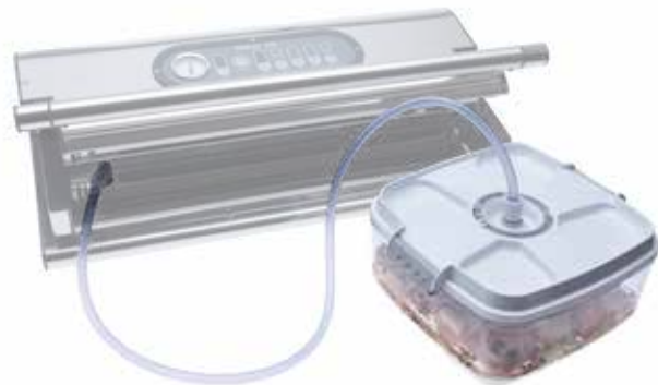
Art. nr. GNV-9361