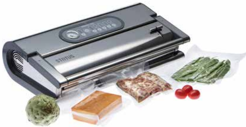
Art. nr. GNV-9360

De Status vacuümmachine set bestaat uit :