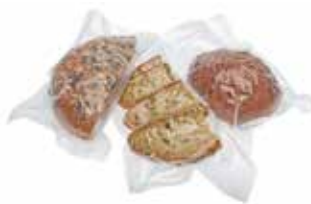
brede vacuümzakken 280 x 360 mm

40 stuks : GNV-9903 100 stuks : GNV-9904