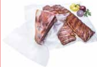
XL folierollen 350 x 3000 mm