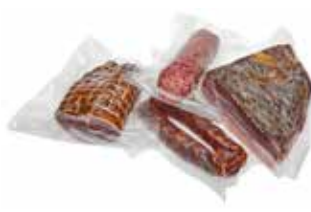
brede folierollen 280 x 3000 mm