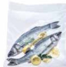
XL vacuümzakken 350 x 400 mm

25 stuks : GNV-9905 100 stuks : GNV-9906