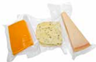
kleine folierollen 200 x 3000 mm