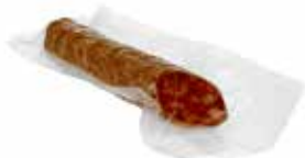
extra kleine vacuümzakken 120 x 550 mm

30 stuks : GNV-9907 100 stuks : GNV-9908