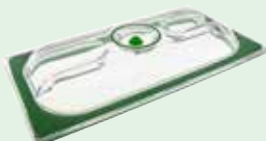
GN1/3 - 325 x 176 mm Art. nr. GNV-9013