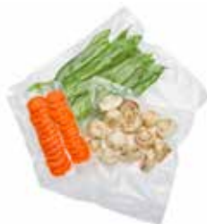
kleine vacuümzakken 200 x 280 mm

30 stuks : GNV-9907 100 stuks : GNV-9908