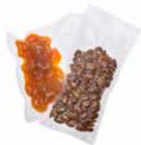
extra kleine folierollen 120 x 3000 mm

25 stuks : GNV-9900 100 stuks : GNV-9901