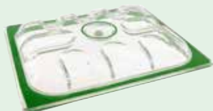
GN1/2 - 325 x 265 mm Art. nr. GNV-9012