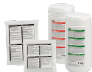
Ontkalkingmiddel en koffieaanslag oplosmiddel